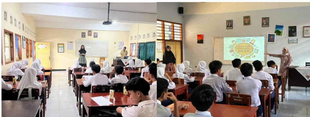
Gambar 3. Kegiatan Sosialisasi Positif Bersosial Media