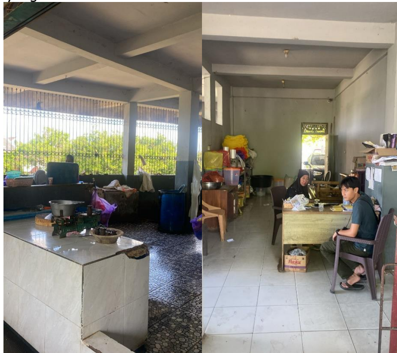
Gambar 1. Lokasi Usaha Ayam Broiler UD. Rizki