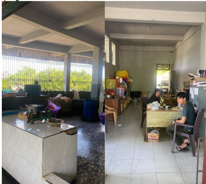
Gambar 1. Lokasi Usaha Ayam Broiler UD. Rizki