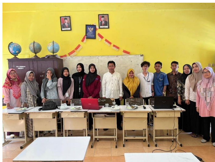
Gambar 4. Foto Bersama Pemilik Usaha

Evaluasi kegiatan dilakukan untuk mengukur keberhasilan dan ketercapaian program yang telah direncanakan. Hal-hal yang menjadi bahan evaluasi kegiatan pengabdian ini adalah berfokus pada keterbatasan waktu pelaksanaan dan tempat dilaksanakan pengabdian. Hal ini dikarenakan kegiatan yang hanya dilaksanakan 1 hari dan dilaksanakan siang hari di lingkungan sekolah, sedangkan peserta kegiatan berharap kegiatan ini dapat dilaksanakan secara berkesinambungan sehingga ilmu yang diperoleh lebih banyak. Pelatihan ini ditutup dengan foto bersama yang terdiri dari tim pengabdian, dan pemilik usaha di Kec. Kuripan Lombok Barat.