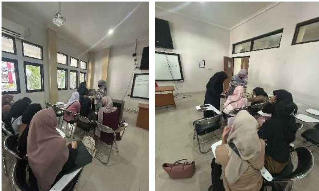
(Gambar 1. Dokumentasi Penyampaian Materi)

Kegiatan pengabdian kepada masyarakat berupa sosialisasi dana darurat untuk Mahasiswa dilakukan di Fakultas Ekonomi dan Bisnis Universitas Mataram. Sosialisasi ini dilakukan atas dasar pentingnya wawasan terkait pengelolaan dana darurat oleh mahasiswa. Berdasarkan hasil observasi awal yang telah dilakukan, mahasiswa fakultas ekonomi dan bisnis Universitas Mataram tidak memiliki pemahaman bahwa dana darurat penting untuk dipersiapkan oleh mahasiswa. Mahasiswa lebih cenderung konsumtif tanpa memikirkan hal-hal tak terduga yang mungkin terjadi, seperti kecelakaan, sakit mendadak, atau kondisi darurat lainnya yang memerlukan dana tambahan. Oleh karena itu, pengenalan dana darurat di kalangan mahasiswa menjadi perhatian utama agar mahasiswa dapat menghadapi tantangan finansial yang mungkin muncul selama masa studi mereka. Universitas Mataram memiliki populasi mahasiswa yang cukup besar dengan beragam latar belakang ekonomi. Kondisi ini memerlukan upaya untuk memahami mahasiswa akan pentingnya persiapan dana darurat sebagai langkah preventif dalam mengatasi keadaan darurat. Beberapa mahasiswa mungkin tidak memiliki pemahaman yang memadai tentang manajemen keuangan, sehingga diperlukan program edukasi salah satunya melalui sosialisasi pengenalan dana darurat kepada mahasiswa.