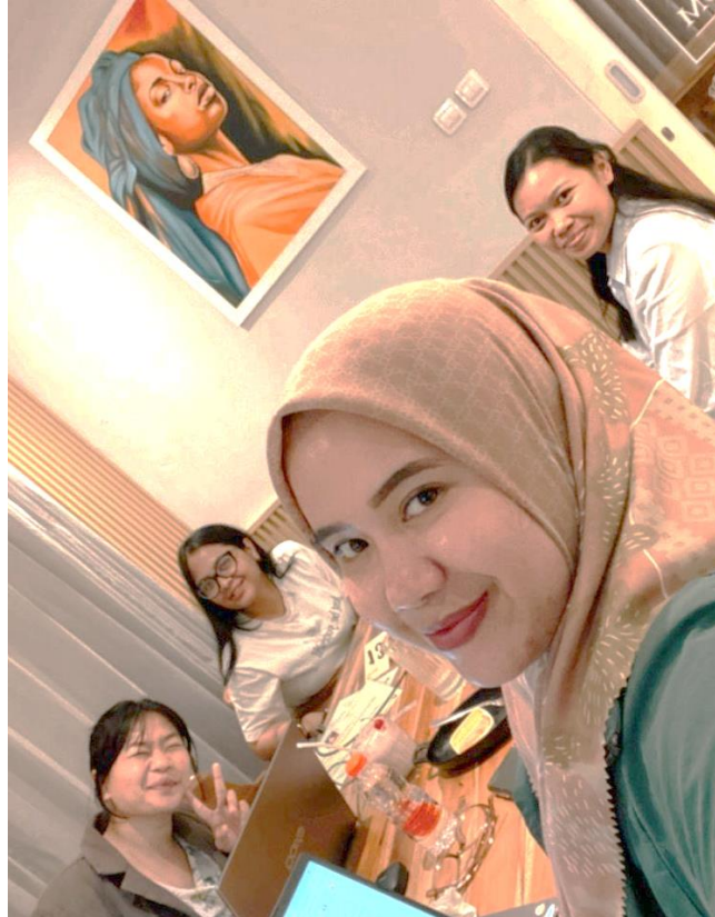
Gambar 1. Pertemuan Pertama Pendampingan Publikasi Artikel Ilmiah

Tahapan awal pengabdian masyarakat ini adalah pertemuan pertama secara tatap muka untuk mencari jurnal internasional yang sesuai dengan syarat kampus, kemudian persiapan manuscript , akun, orcid id, sampai dengan proses submission awal. Peserta pengabdian masyarakat terdiri dari 3 orang mahasiswa program studi Magister Akuntansi Universitas Mataram. Pertemuan pertama dilakukan pada tanggal 10 Juni 2025 di Cafe Eqlair Mataram.