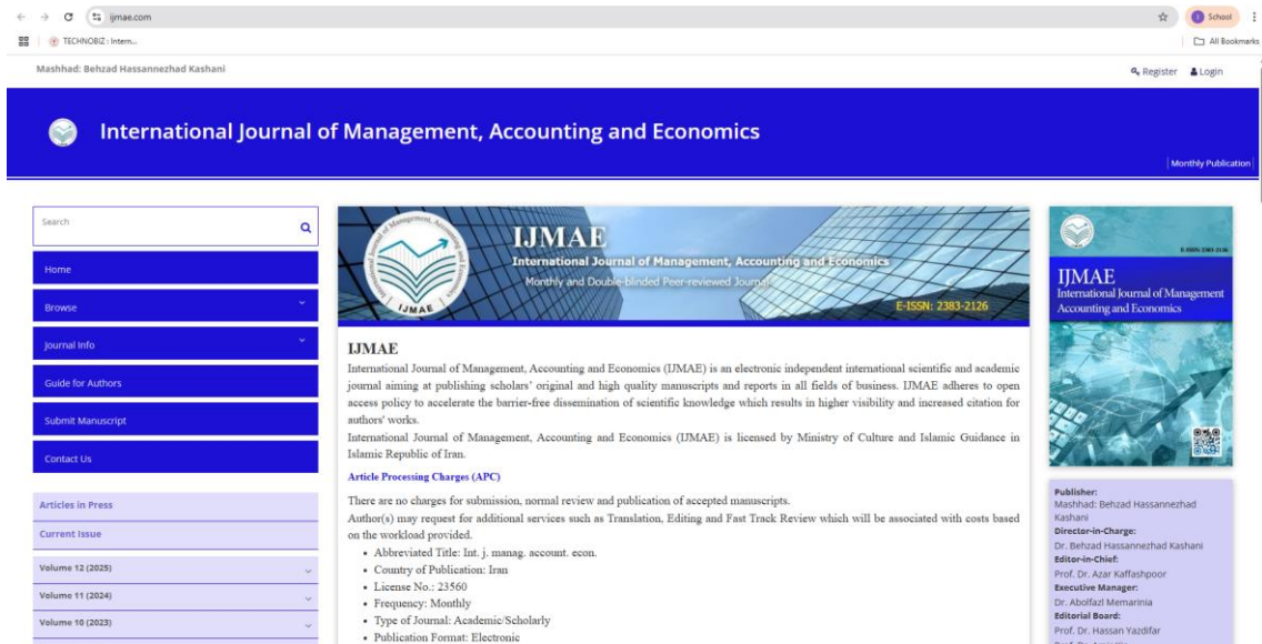
Gambar 2. Tampilan Jurnal Internasional Tujuan

Setelah menunggu selama 2 minggu, akhirnya peserta mendapatkan revisi dari reviewer dan melakukan diskusi kembali secara online untuk menuntaskan revisi yang diterima.