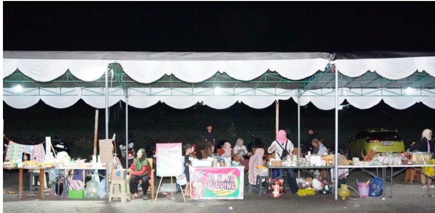
Gambar 5. Pemberdayaan UMKM

Selama festival berlangsung, aktivitas pengunjung di area UMKM cukup tinggi dan memberikan peluang tambahan pendapatan bagi pelaku usaha lokal. Kondisi ini menunjukkan bahwa kegiatan budaya memiliki potensi untuk dikembangkan sebagai bagian dari ekonomi kreatif masyarakat.