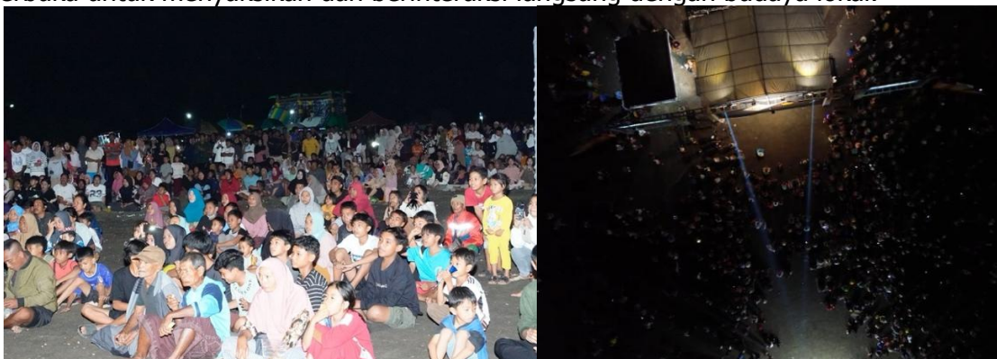
Gambar 3. Antusiasme Masyarakat

Salah satu hasil utama dari kegiatan ini adalah meningkatnya ruang apresiasi masyarakat terhadap seni tradisional lokal. Sebelum kegiatan dilaksanakan, pertunjukan budaya di Kecamatan Kayangan masih bersifat terbatas dan hanya muncul pada acara tertentu. Kondisi tersebut menyebabkan interaksi masyarakat dengan seni tradisional semakin berkurang. Melalui Festival Gawe Beleq, masyarakat kembali memperoleh ruang terbuka untuk menyaksikan dan berinteraksi langsung dengan budaya lokal.