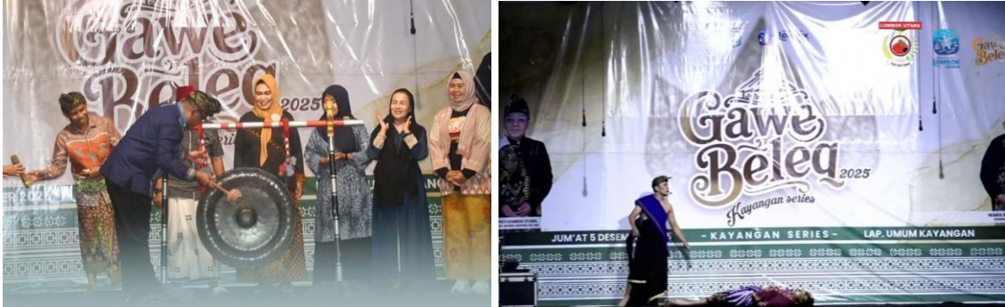
Gambar 2. Pelaksanaan Festival

bersama. Festival berlangsung secara terbuka sehingga masyarakat dapat terlibat langsung sebagai penonton, peserta kegiatan, maupun pelaku usaha lokal.