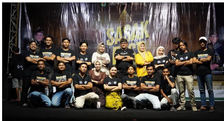
Gambar 4. Partisipasi Pemuda Lokal

Pelaksanaan festival menunjukkan adanya peningkatan keterlibatan masyarakat khususnya generasi muda. Generasi muda tidak hanya hadir sebagai penonton, tetapi juga terlibat dalam persiapan kegiatan, pengelolaan acara, dan pertunjukan seni tradisional. Hal ini terlihat dari keterlibatan generasi muda khususnya yang berasal dari kecamatan kayangan sebagai panitia pelaksana kegiatan.